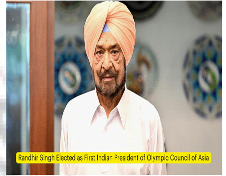
Randhir Singh Elected as First Indian President of Olympic Council of Asia

(C) हाल ही में अनुभवी खेल उद्घाटन रणधीर सिंह एशियाई संस्था की 44वीं आम सभा में एशियाई ओलंपिक परिषद के पहले भारतीय अध्यक्ष के चयन के लिए तैयार हैं। पूर्व भारतीय निशानेबाज रणधीर सिंह को खेल मंत्री मनसुख मंडाविया और एशिया के सभी 45 देशों के शीर्ष अधिकारियों की नियुक्ति में आधिकारिक तौर पर ओएसिया अध्यक्ष नामित किया जाएगा।